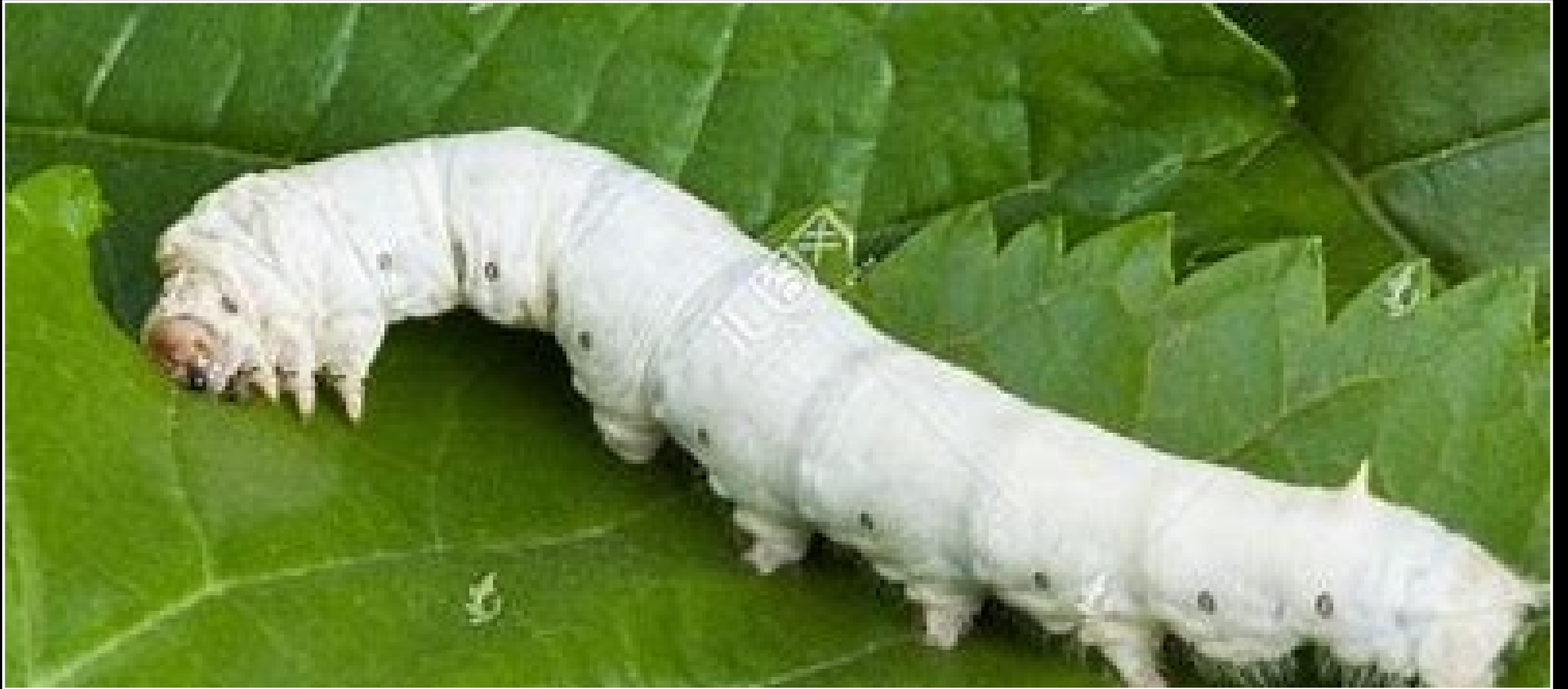
cán 蚕 : silkworm