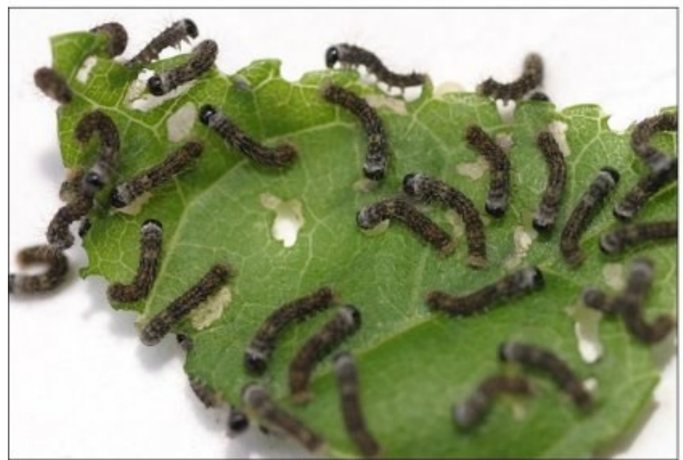
inon EQ5 10D F3.6 1/500r ISO400 -0.5EV