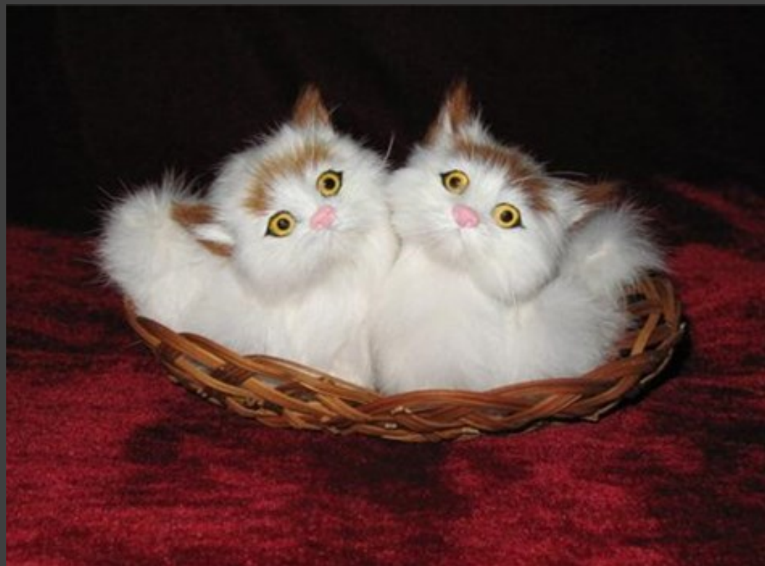
Top.5, 暹xian罗猫 Siamese Luo cat