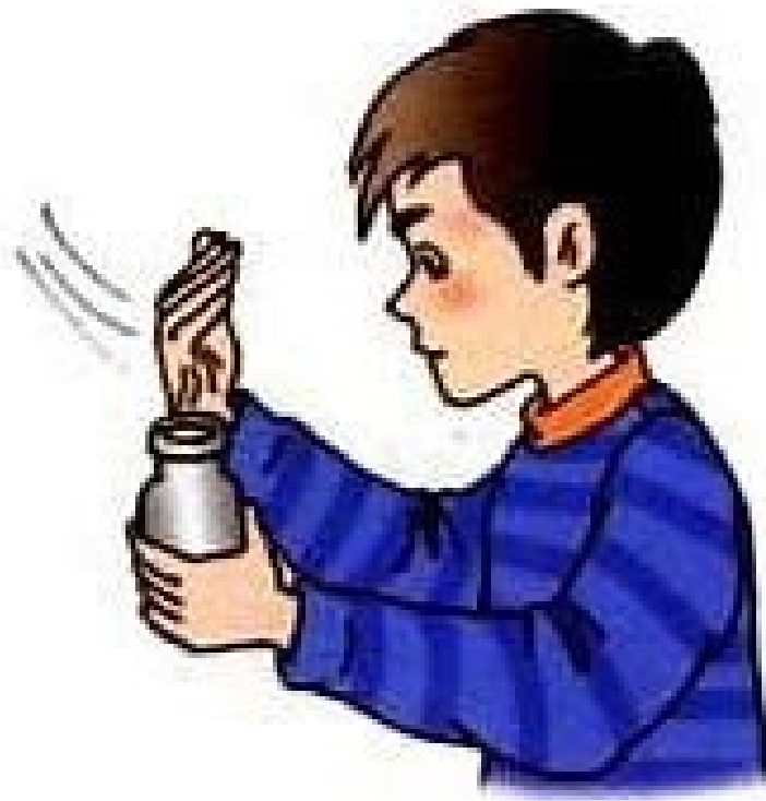
图 4-15 闻气体时的正确操作