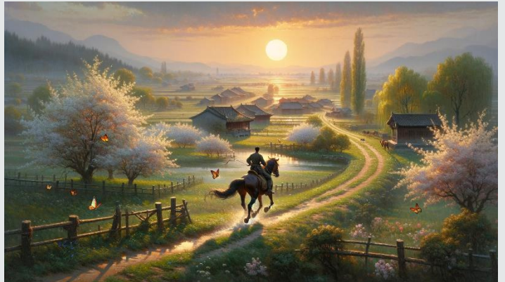
插画：踏花归去马蹄香