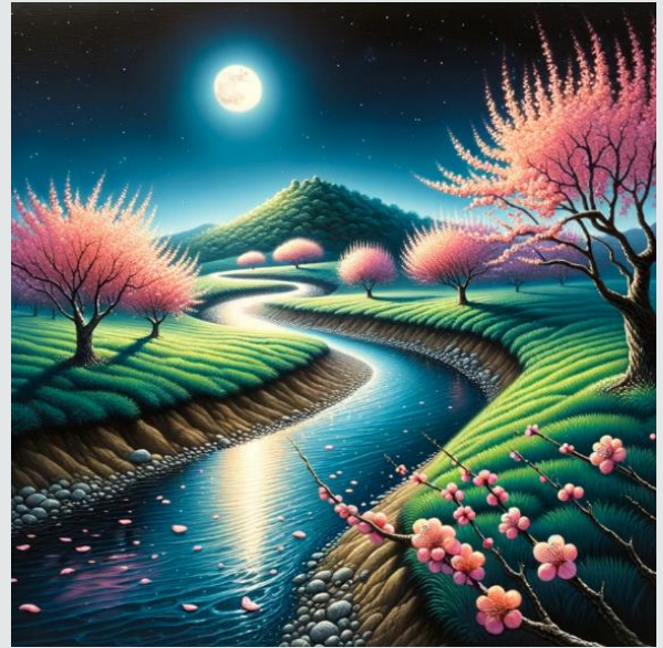
风景画：花儿落入溪中，纷纷如雨。溪水向东流，花儿一同随水去。只有光明的月亮，映在水中，千年万年流不去。